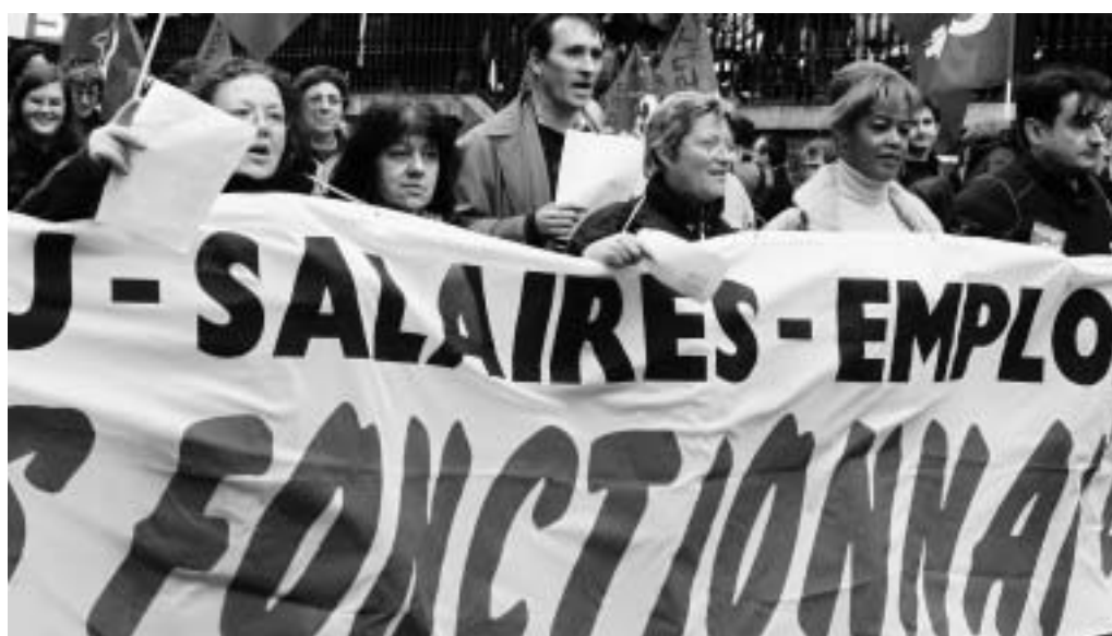
Les fonctionnaires rejettent les propositions salariales imposées sans accord préalable par Christian Jacob.

Après la signature d'un accord concernant deux volets de la négociation dans la fonction publique - social et statutaire - avec trois syndicats minoritaires (CFDT, CFTC et Unsa), M. Jacob a décidé d'imposer ses propositions salariales, malgré le rejet unanime des syndicats. Deux revalorisations de 0,5% interviendront au 1er juillet 2006 et au 1er février 2007. Elles seront complétées par l'attribution d'un point d'indice (qui entre dans le calcul des salaires) supplémentaire à chaque agent au 1er novembre 2006, correspondant à une augmentation de 0,2% selon le ministère. Tous les syndicats ont jugé ces propositions insuffisantes et réclament le maintien du pouvoir d'achat pour cette année, basé sur l'inflation prévue à 1,8% dans le budget 2006.