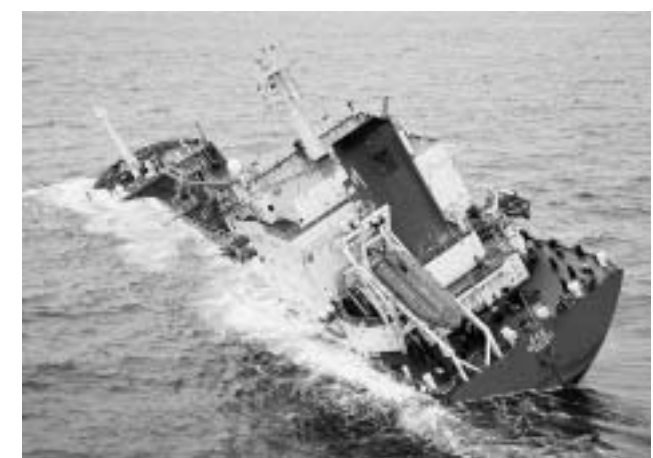
L'Ece a coulé dans la Manche vers 03h30 à environ 90 km à l'ouest de la pointe de La Hague.

La préfecture maritime a pris « par précaution » un arrêté d'interdiction de la pêche dans un rayon d'un mille nautique (1,8 kilomètre) autour de l'épave. Mais une pollution grave semble exclue, selon les autorités, car l'acide phosphorique se dissout rapidement dans l'eau de mer. L'association de défense de l'environnement Robin des bois a en revanche estimé que « l'acide est un produit dangereux à forte concentration qui va brûler la flore et la faune dans un rayon de plusieurs centaines mètres autour de l'épave ».